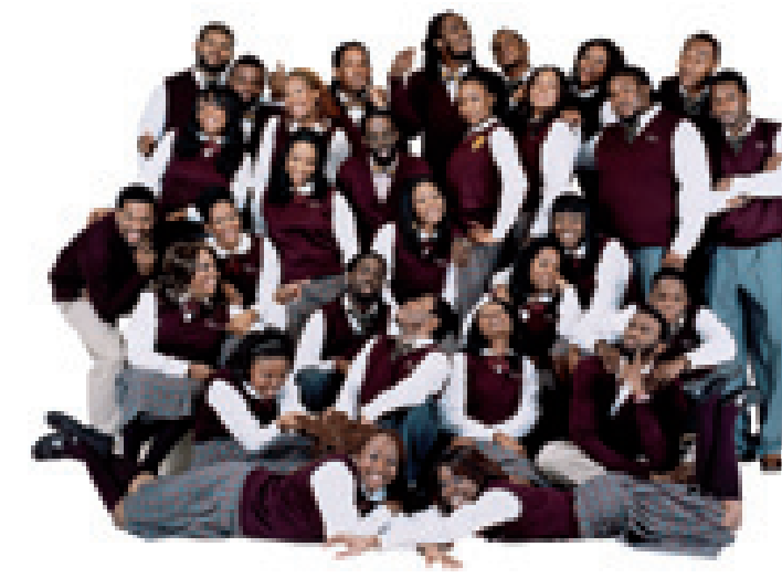
Tye Tribbet & G.A.

Originario de Camden, New Jersey y proveniente de una gran tradición Gospel (su padre era predicador y su madre directora de coro), el cantante, compositor, director y multiinstrumentista Tye Tribbett da vida a Tye Tribbett and the Greater Anointing (G.A.) a finales de los 90. Aprendió a tocar los teclados antes de que pudiera recitar el alfabeto. Cuando uno escucha sus letras siente el espíritu de la música Gospel. Ha realizado varias colaboraciones con artistas como Elton John, Will Smith, Justin Timberlake y Sting. La tradición Gospel, fusionada con pop, jazz, R&B y neo-soul, le han colocado en un lugar preferente. Tye Tribbett & G.A. han sido nominados dos veces en los premios Grammy: "Mejor Música contemporánea Rhythm & Blues/Gospel" y "Mejor Actuación Gospel"