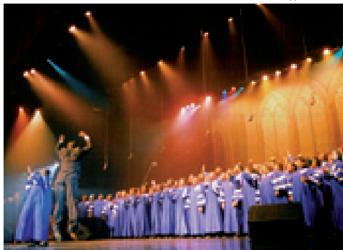
Mississippi Mass Choir