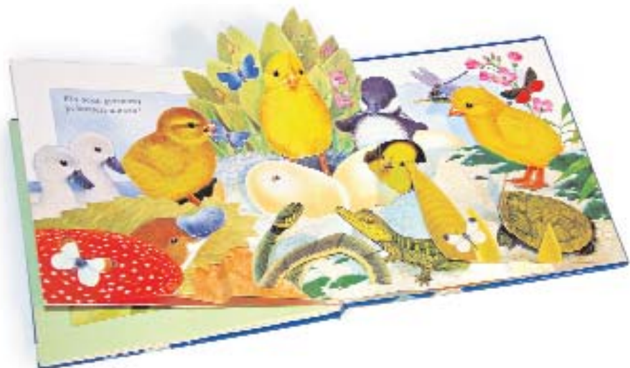
Una aventura amb Groguet. M. Pledger. 1996

La Segona Guerra Mundial va portar l'escassetat de paper i mà d'obra, però no va acabar amb la tasca creativa d'artistes com ara Julian Wehr, les obres del qual van ser publicades al nostre país per l'editorial Cervantes de Barcelona. També cal destacar en aquesta difícil època bèl·lica la firma nord-americana Random House , que va aconseguir mantenir una tímida però eficaç producció que va permetre que els llibres mòbils no fossin del tot oblidats.