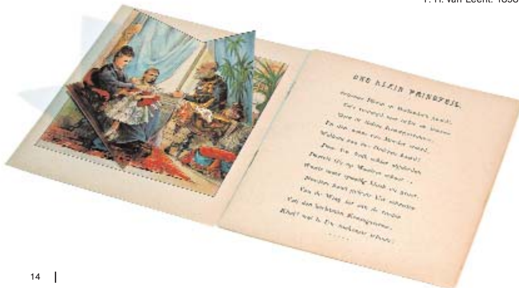
Van Prinsesje tot Konningin. F. H. van Leent. 1898

El 1524 es va publicar un llibre sobre astrologia amb elements mòbils: Cosmographia de Petrus Apianus, nom llatinitzat del matemàtic alemany Peter Bienewitz (1495-1552).