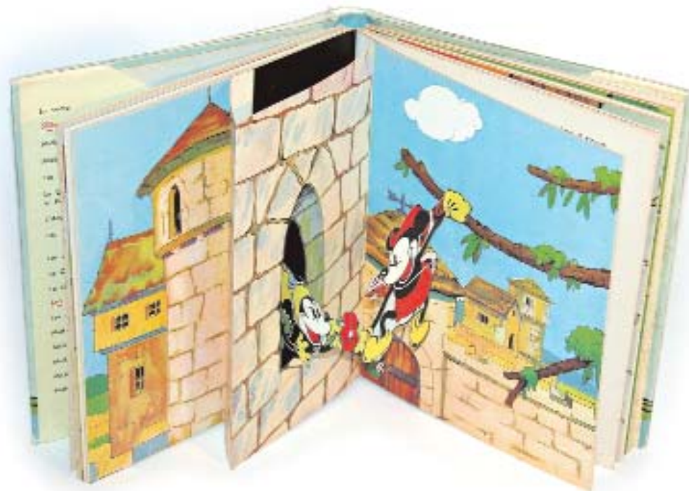
Mickey et le prince Malapatte. 1935

La editorial londinense Dean & Son, fundada en 1800, fue la primera en dedicarse a la producción a gran escala de lo que ellos denominaron "toy-books" (libros-juguete) en los que introdujeron numerosos mecanismos.