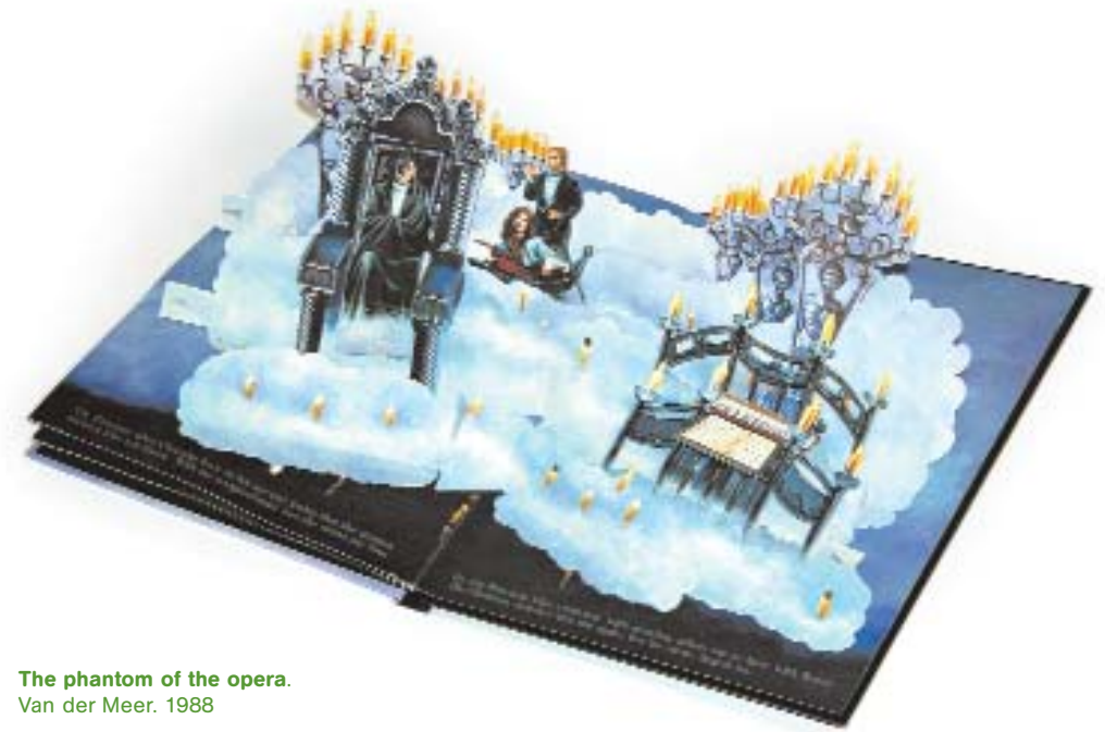
The phantom of the opera. Van der Meer. 1988

La creació d'un llibre desplegable comença amb un concepte, una història i una situació. Un cop s'han establert aquests pilars bàsics, el projecte passa a l'enginyer de paper, que pren idees de l'autor i l'il·lustrador per donar moviment als personatges i acció a les escenes. La tasca de l'enginyer de paper ha de ser pràctica i imaginativa alhora. Ha de determinar com s'han d'accionar les peces en les pàgines sense que es trenquin, quines zones necessiten goma, quina longitud ha de tenir una pestanya per estirar-la i quant es pot elevar una peça.