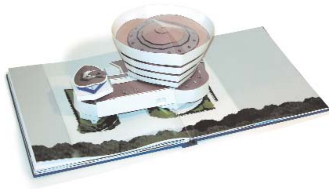
Frank Lloyd Wright in pop-up. I. Thomson. 2002

Per valorar justament aquesta màgica irrupció del teatre dins del llibre, cridem l'atenció del visitant en el sentit que totes aquestes arquitectures de paper retornen al seu format bidimensional un cop es tanca el llibre; i això és precisament el que els diferencia d'una maqueta o un petit teatre, i alhora els manté en la seva condició de llibres.