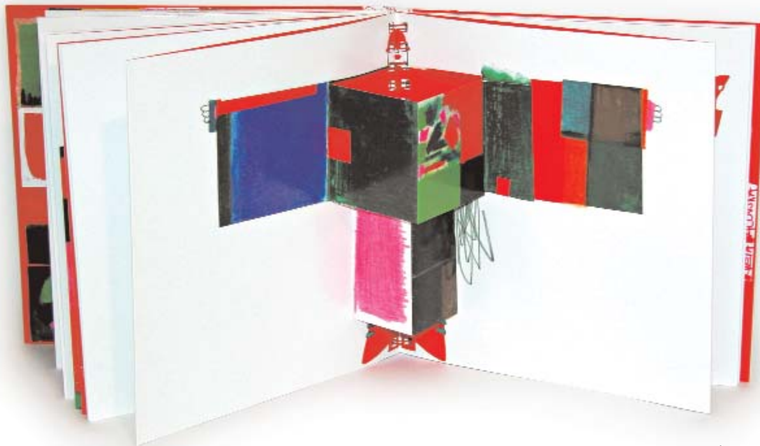
Alphabet. Kveta Pacovská. 1996

La delicadeza de estos libros y el mayoritario público infantil al que van destinados son la causa de la escasa vejez de los mismos y del mayor aumento de su valor bibliográfico.