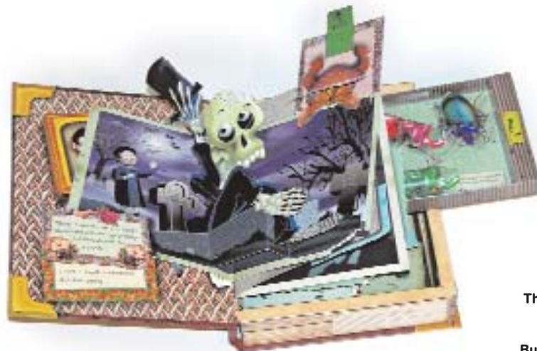
The spooky scrapbook. K. Moerbeek. 2000

La creación de un libro desplegable comienza con un concepto, una historia y una situación. Una vez que se han establecido estos pilares básicos, el proyecto pasa al ingeniero de papel, que toma ideas del autor y del ilustrador para dar movimiento a los personajes y acción a las escenas. La tarea del ingeniero de papel debe ser a la vez práctica e imaginativa. Debe determinar cómo deben accionarse las piezas en las páginas sin que ésta se rompa, qué zonas necesitan pegamento, qué longitud debe asomar una pestaña para tirar de ella y cuánto puede elevarse una pieza.