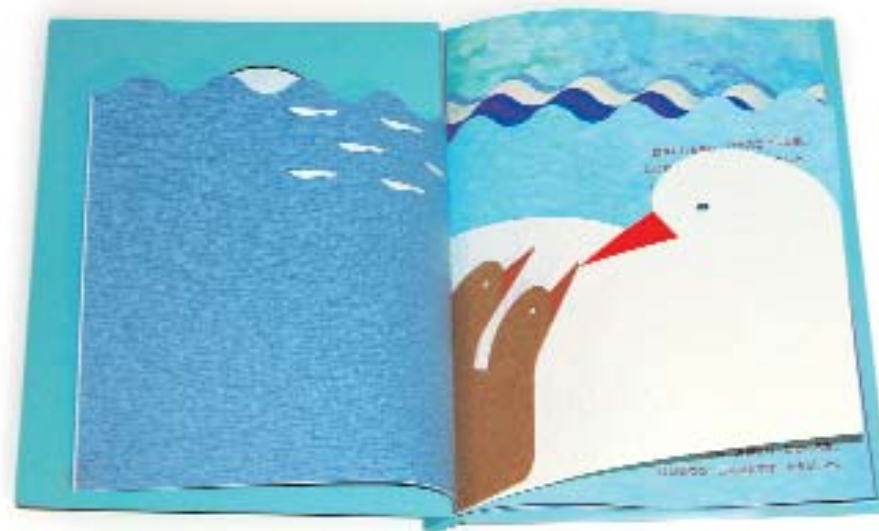
Azul sobre azul. K. Komagata. 1994

La Segunda Guerra Mundial trajo escasez de papel y mano de obra, pero no acabó con la labor creativa de artistas como Julian Wehr cuyas obras fueron publicadas en nuestro país por la editorial Cervantes de Barcelona. También es destacable en esta difícil época bélica la firma norteamericana Random House que consiguió mantener una tímida pero eficaz producción que permitió que los libros móviles no cayeran en el olvido.