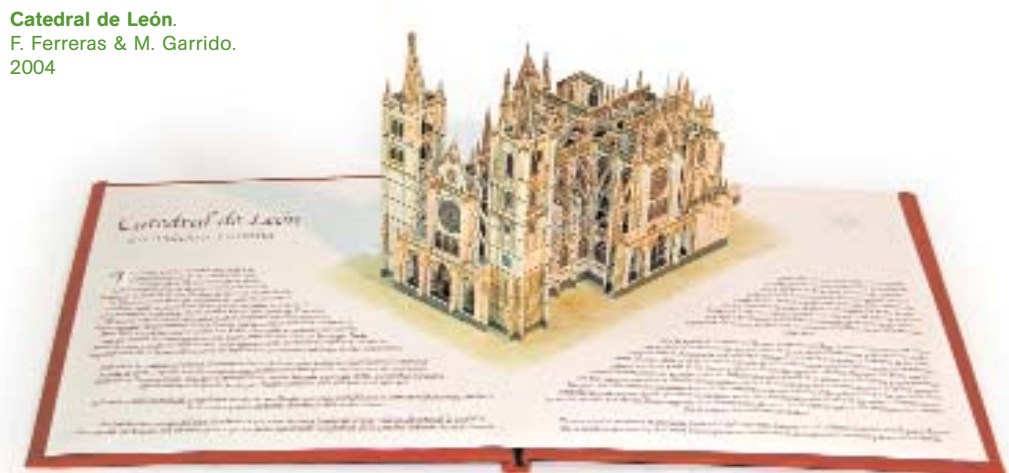
Catedral de León. F. Ferreras & M. Garrido. 2004