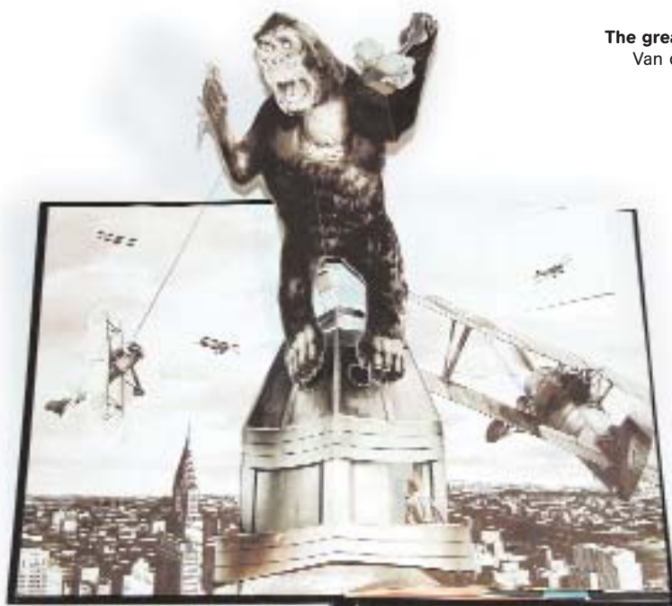
The great movies live! Van der Meer. 1987

Una de les coses que sorprèn primer en aquests llibres és la seva autoria; els signen un escriptor, un il·lustrador i un enginyer de paper . Aquest és el responsable de crear el mecanisme de paper que permet que la il·lustració esdevingui tridimensional i que es torni a plegar en el seu interior quan es tanca el llibre.