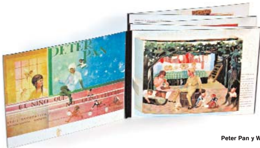
Peter Pan y Wendy. A. Saló. 1935

L'editorial londinenca Dean & Son, fundada el 1800, va ser la primera a dedicar-se a la producció a gran escala del que ells van anomenar toy-books ('llibres-joguina'), en els quals van introduir molts mecanismes.