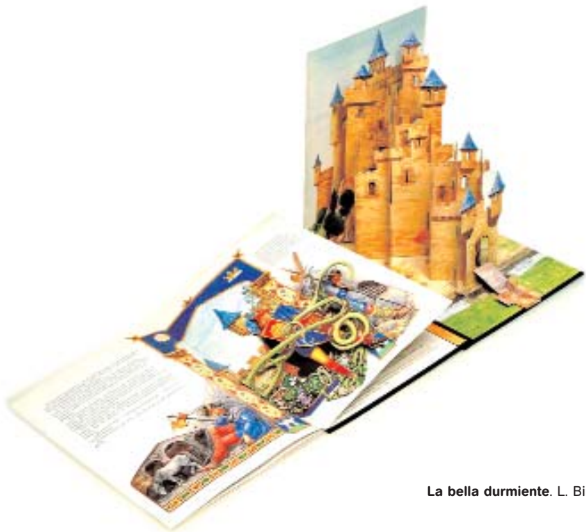
La bella durmiente. L. Birkinshaw. 1993

Generalment relacionats amb el món dels nens, aquests híbrids entre llibre i joguina no sempre estan destinats al públic infantil, ja que abasten una temàtica molt àmplia i per a un públic molt variat.