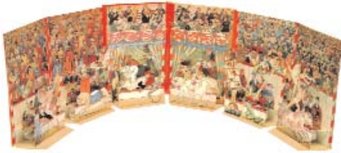
Internationaler circus. L. Megendorfer. 1878

No se sap qui va introduir el primer artifici mecànic en un llibre, però un dels exemples més primerencs que es coneixen es deu a Ramon Llull (1233-1316), que va il·lustrar les seves teories filosòfiques amb rodes giratòries de paper. A la biblioteca d'El Escorial es conserva una antologia de la seva obra i pensament sota el títol d' Ars Magna , un manuscrit del segle XVI que incorpora figures rotatòries que intenten explicar l'existència de Déu a través de la numerologia. Mecanismes similars, basats en discos giratoris, han estat utilitzats des dels temps de Llull amb finalitats tan diverses com fer prediccions astronòmiques, crear codis secrets o predir el futur.