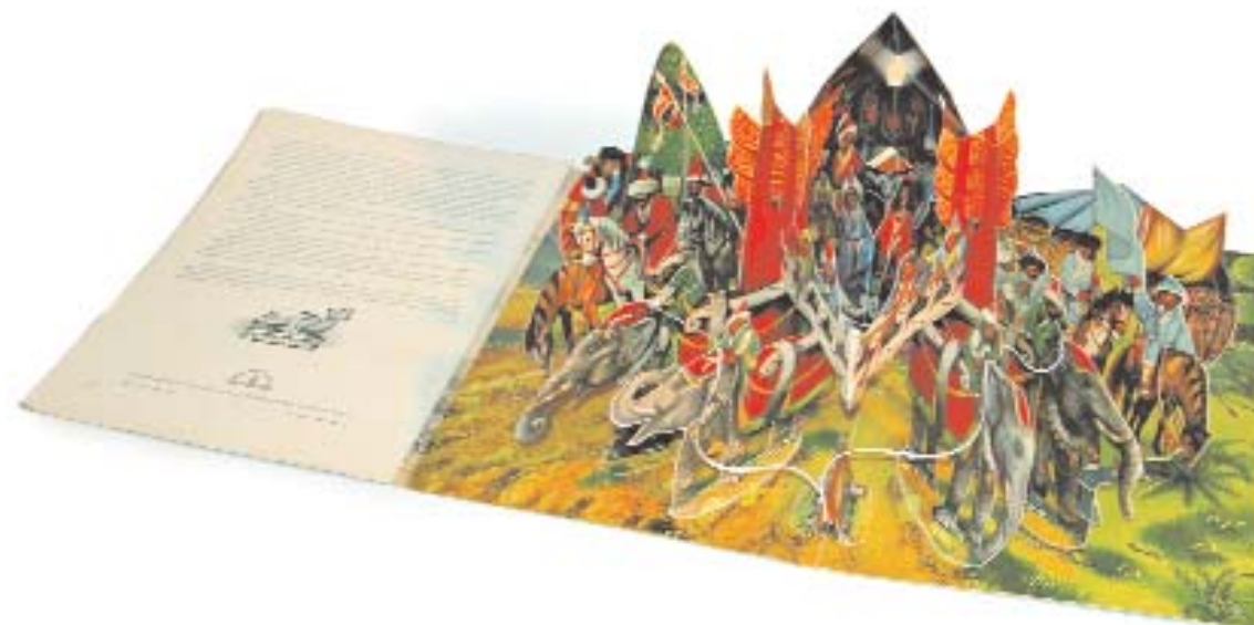
Marco Polo. V. Kubasta. 1962

A esta seducción no se ha resistido el grupo teatral catalán Els Comediants que en 1984 lanzó al mercado Sol/ Solet , un libro-objeto publicado por Edicions de