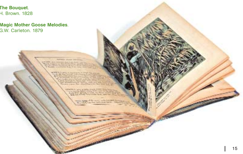
Magic Mother Goose Melodies. G.W. Carleton. 1879

No se sabe qui introdujo el primer artifici mecànic en un llibre, però uno de los ejemplos más tempranos que se conocen se debe a Ramon Llull de Mallorca (1233-1316) qui il·lustrà les seves teories filosòfiques amb rodes giratòries de paper. En la biblioteca de El Escorial se conserva una antologia de su obra y pensamiento bajo el título de Ars Magna , un manuscrito del siglo XVI que incorpora figuras rotatorias que tratan de explicar la existencia de Dios a través de la numerología. Mecanismos similares, basados en discos