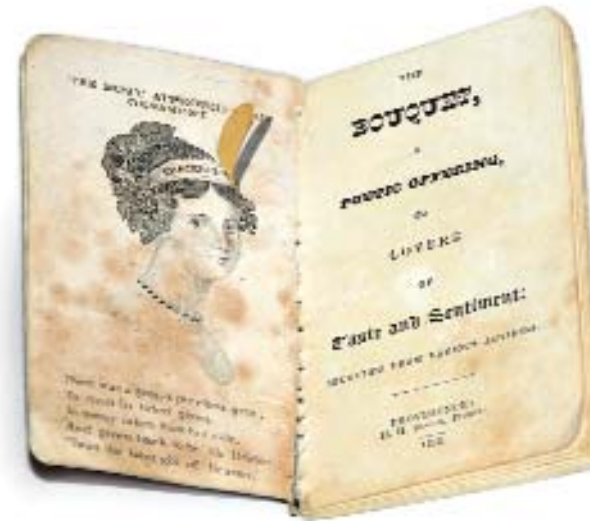
The Bouquet. H. Brown. 1828