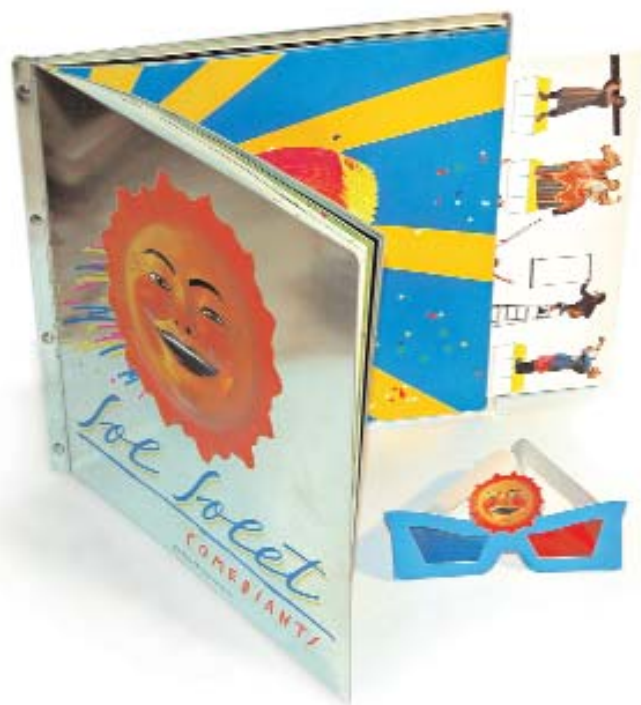
Sol solet. Els Comediants. 1984

Para valorar en su justa medida esta mágica irrupción del teatro dentro del libro, llamamos la atención del visitante en el sentido de que todas estas arquitecturas de papel retornan a su formato bidimensional cuando el libro se cierra; y eso es precisamente lo que les diferencia de una maqueta o un teatrillo y les mantiene en su condición de libros.