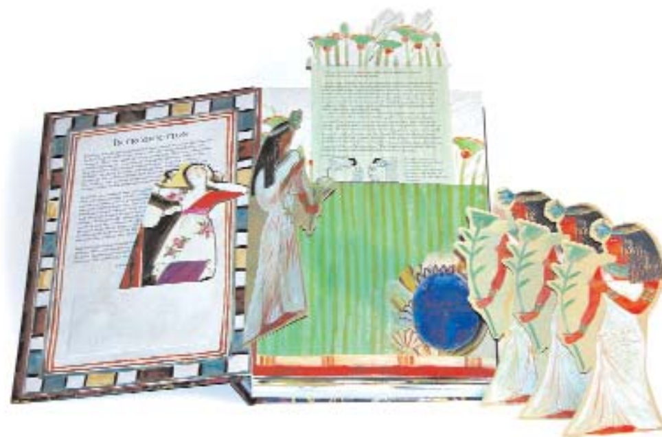
Fashion-à la Mode. D. Hawcock. 2000

Des de l'antiguitat l'home ha intentat desafiar els límits bidimensionals de la pintura i ha intentat donar profunditat i moviment a les imatges planes. Fa 20.000 anys, quan els habitants de les coves d'Altamira van pintar els seus bisons, van buscar les protuberàncies de la roca per conferir volum al cos dels animals que representaven.