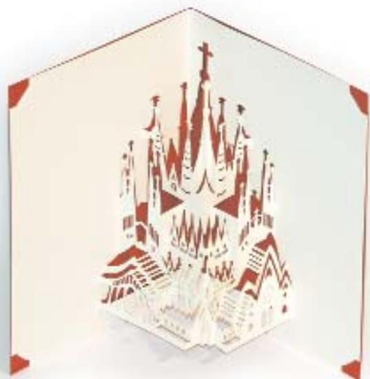
Sagrada Família. I. Siliakus. 2004

A les dècades de 1930 i 1940 tres editorials barcelonines més van destacar en la producció de llibres desplegable: l'editorial Maravilla amb la seva col·lecció de «Contes en Moviment», l'editorial Selva i els seus «Àlbums Relleu» i l'editorial Juventud, que va publicar el 1935 un preciós Peter Pan .